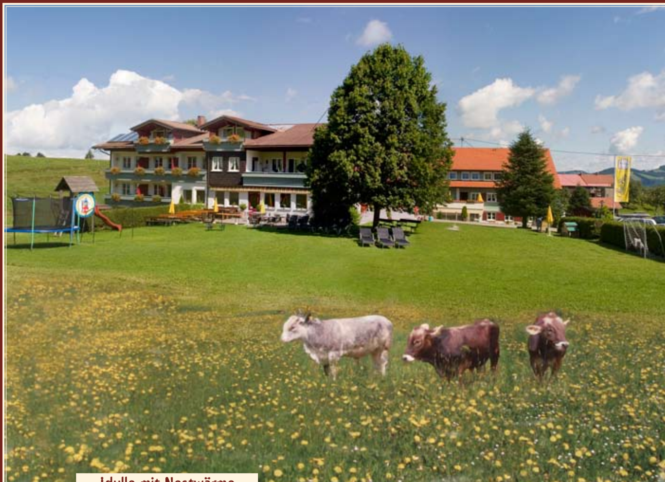
Idylle mit Nestwärme