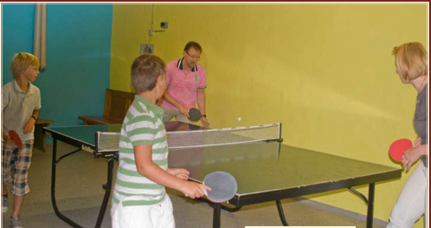
Tischtennisraum mit Kicker

Langeweile ist im »Starennest« ein Fremdwort. Und es ist gut zu wissen, dass die Jugend bei uns gut aufgehoben ist. Immer ist etwas los, sei es draußen oder drinnen, sei es Sommer oder Winter.