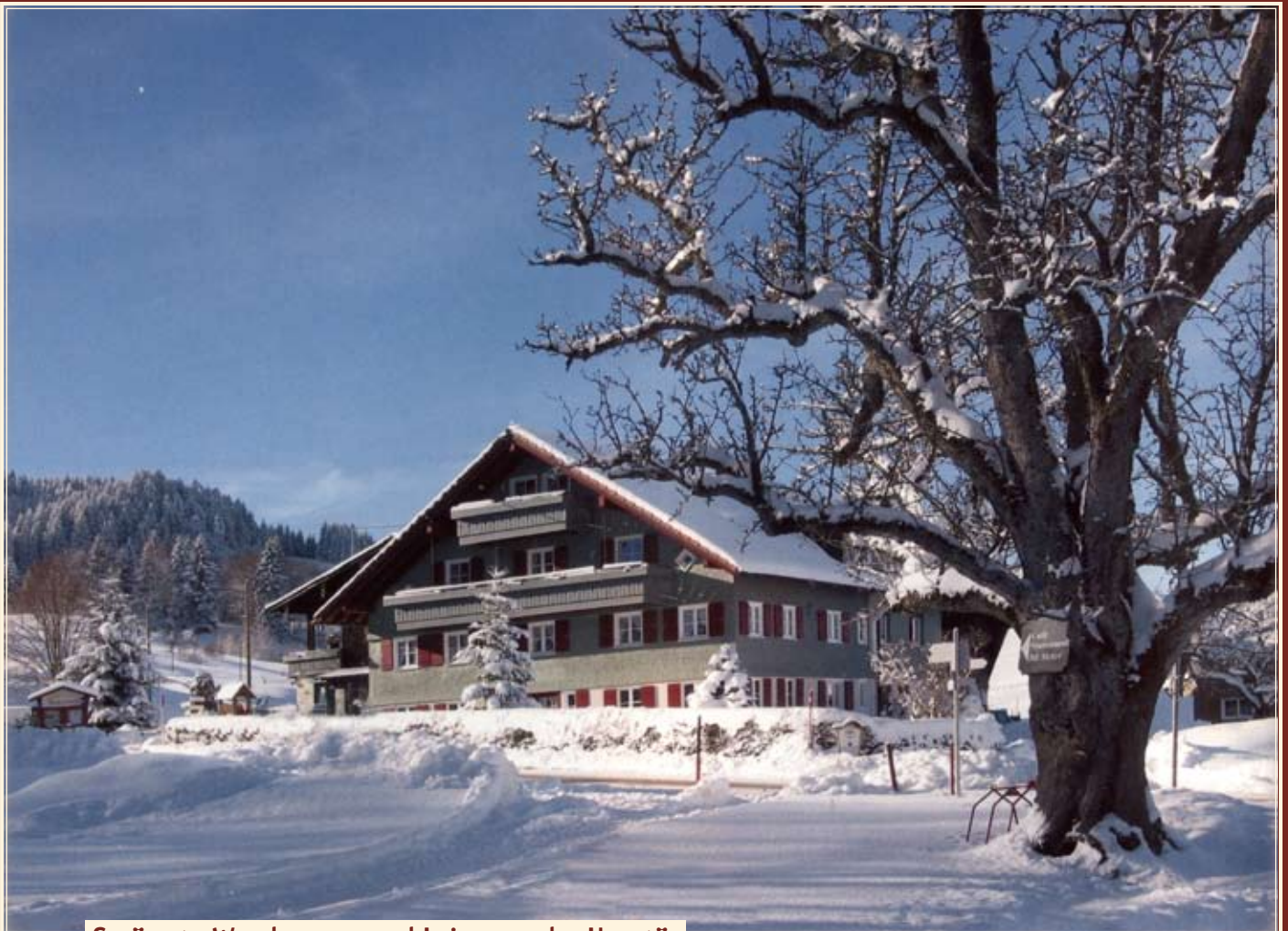
Geräumte Wanderwege und Loipe vor der Haustür

Maschinengepflegte Pisten erwarten Sie. Brettelfans jeder Könnensstufe kommen voll auf ihre Kosten.