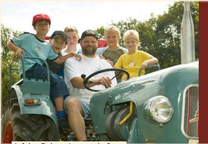
Auf dem Traktor sitzen macht Spass