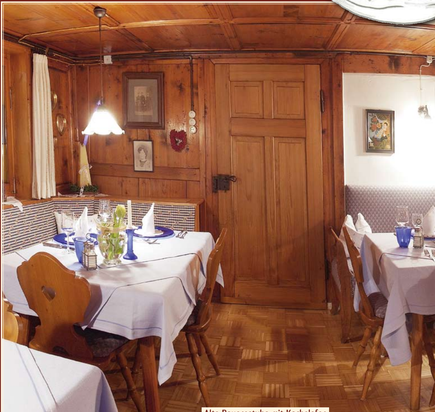
Alte Bauernstube mit Kachelofen